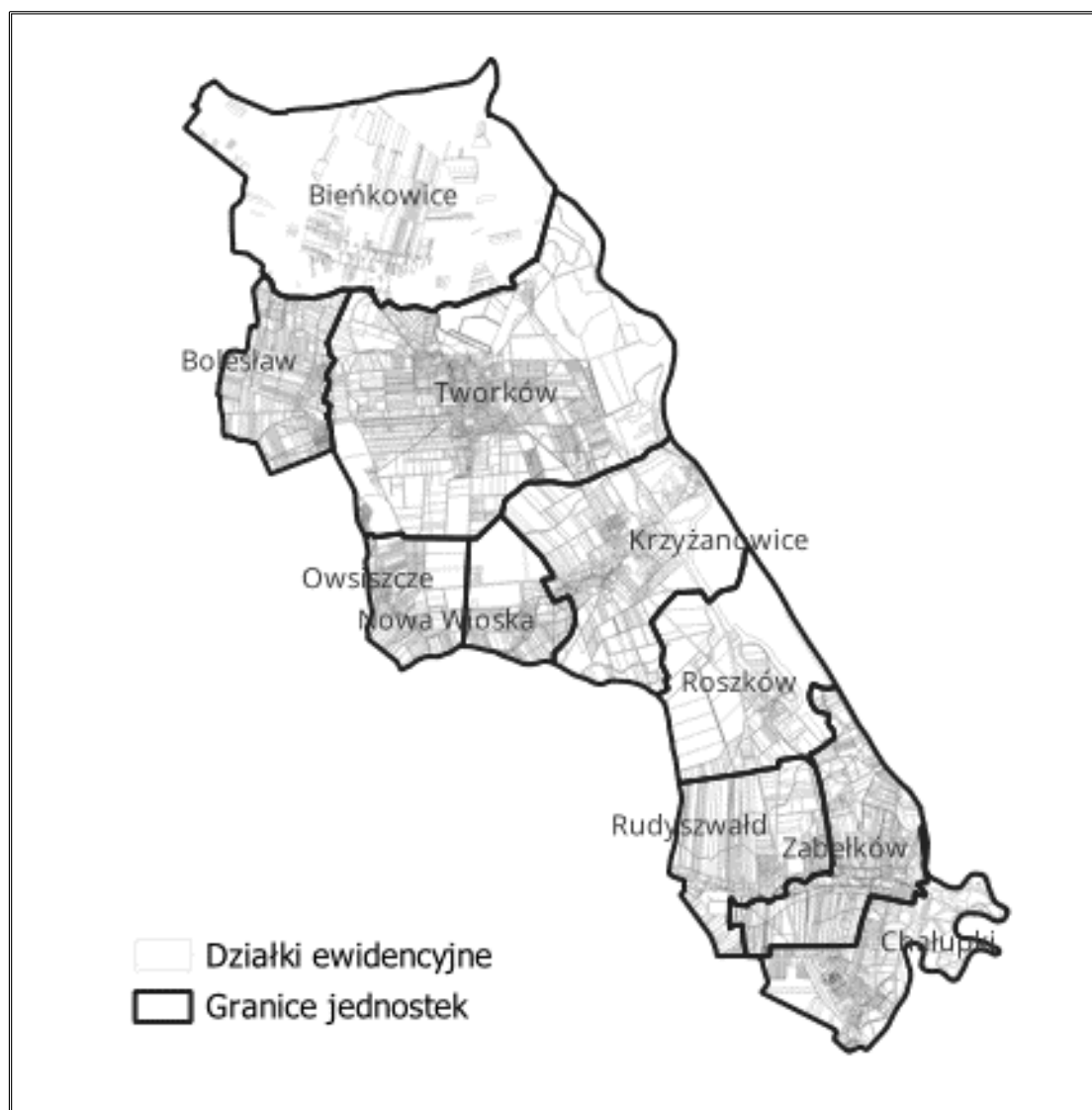
Rysunek 1. Podział gminy Krzyżanowice na jednostki

W celu przestrzennego zobrazowanie wyników analizy, gminę Krzyżanowice podzielono na jednostki, składające się z sołectw.